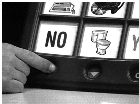
Marco alza il volume di Go Talk prima di uscire.

Il volume basso è utile durante una conversazione privata, oppure quando il messaggio costituisce un suggerimento soltanto per l’utente, e non è necessario che venga sentito dalle altre persone. Il volume alto, invece, è utile in un ambiente rumoroso, oppure durante una conversazione di gruppo. Nella maggior parte dei casi, tuttavia, è consigliabile regolare Go Talk su un’impostazione media del volume.