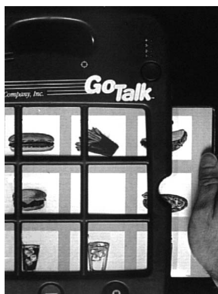
Gli overlay scorrono facilmente dentro e fuori le guide di Go Talk.

Un overlay dovrebbe fornire all'utente un efficace suggerimento riguardo lo scopo di ogni messaggio. È pertanto essenziale effettuare una scelta accurata di ogni figura, simbolo o parola da riportare sull'overlay.