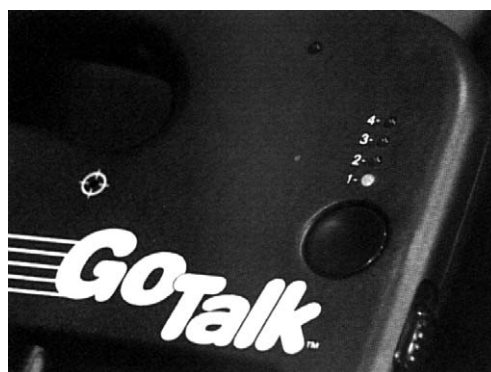
Gli indicatori luminosi verdi indicano su quale livello è impostato Go Talk.

I livelli possono essere sostituiti a seconda dell'ambiente, delle attività o delle situazioni in cui viene a trovarsi l'utente. Ad esempio, il livello uno può essere utilizzato per la lezione di matematica; il livello due, per il pranzo, e così via. La maggior parte degli utenti non