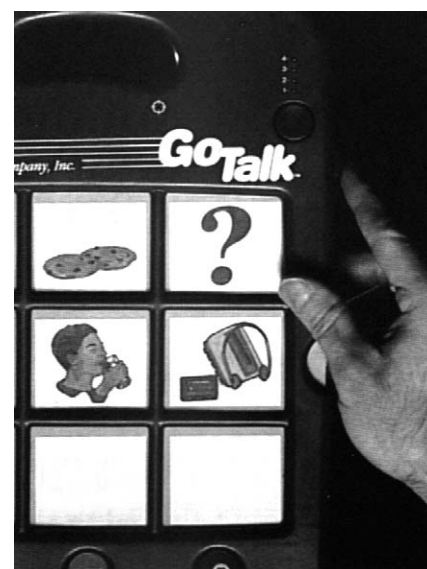
Per rimuovere un overlay da Go Talk, fate scorrere verso l'alto e tenete premuto il pulsante per il rilascio degli overlay.