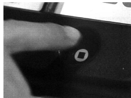
Il pulsante di registrazione si trova nella parte inferiore destra di Go Talk.