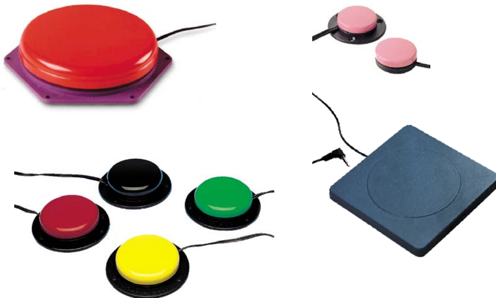
Figura 5: alcuni sensori che è possibile collegare ai giocattoli.

Con una piccola modifica o impiegando semplici soluzioni disponibili in commercio, è possibile collegare a questi giocattoli un tasto esterno, spesso colorato e di grandi dimensioni.