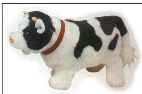
Figura 1: la mucca di peluche muove la testa, cammina in avanti, muggisce.