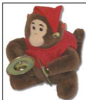
Figura 4: una scimmietta che muove le braccia e suona i piatti.