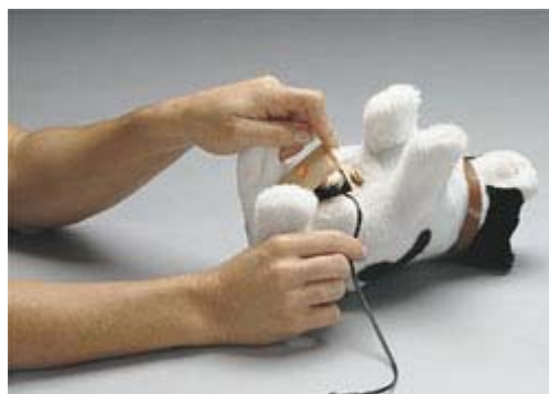
Figura 8 : collegamento dell'adattatore al giocattolo

Il collegamento del sensore avviene in modo molto semplice. Si deve: