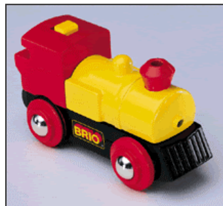
Figura 2: un trenino a batterie.