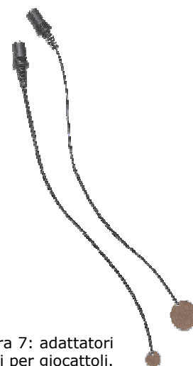
Figura 7: adattatori commerciali per giocattoli.

Si tratta di piccoli cavetti che possiedono, a un'estremità, una piastrina di rame che viene inserita fra le batterie e il loro contatto; all'altra estremità hanno una presa femmina per gli spinotti mini-jack dei sensori reperibili in commercio.