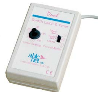
Figura 9: dispositivo Switch Latch and Timer prodotto da AbleNet.

Se usando un giocattolo adattato vi accorgete che il bambino ha difficoltà a mantenere una pressione continuata sul sensore, probabilmente vi serve un dispositivo di temporizzazione come quello mostrato in figura.