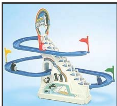
Figura 3: i pinguini salgono con la scaletta sulla montagna, poi scivolano giù.