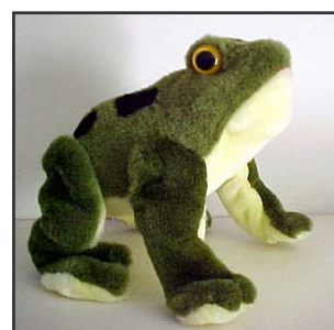
Figura 2: questa rana gracida e salta in avanti.