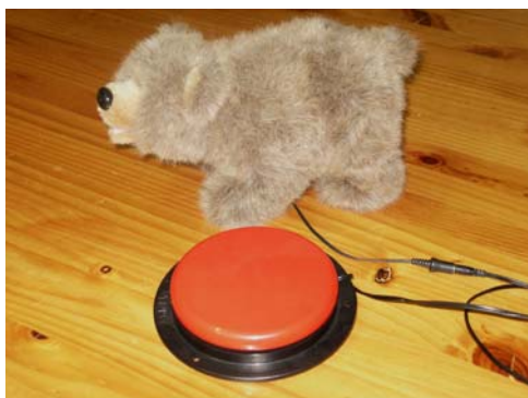
Figura 6: il giocattolo a cui è stato collegato un sensore.

Se il vostro bambino ha difficoltà a mantenere una pressione prolungata sul pulsante, consultate, più avanti, il capitolo Modifiche al funzionamento del sensore .